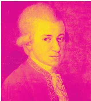
Fotografija: Wikimedia, Johann Nepomuk della Croce

Kad bismo tražili poveznice između Mozartovih skladbi u prvom dijelu programa i Chopinovih u drugom, za oko bi nam zapeo koncept kojim se (barem pretpostavljam) vodio Ivo Pogorelić u sastavljanju svojega novog koncertnog programa. Oba dijela programa završavaju velikim sonatama, koje pripadaju najpopularnijim djelima obojice skladatelja. Popularnost kod šire publike ponajprije duguju svojim krajnjim stavcima: Alla turca (popularno nazvan Turski marš ) zaključuje Mozartovu Sonatu u A-duru, KV 331, dok je Marche funèbre ( Posmrtna koračnica ) treći stavak Chopinove Sonate u b-molu, op. 35. Tim sonatama prethode nešto kraće forme: dvije Mozartove Fantazije srednje duljine trajanja (KV 397 i KV 475) te tri minijature – Chopinove Mazurke, op. 59.